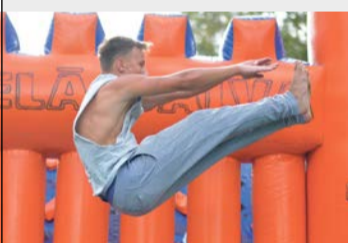
Tika noskaidroti Lielās Balvas izcīņas laureāti Olaines novadā