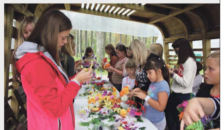
Radošajā darbnīcā meitenes iemācījās pīt ziedu vainagus