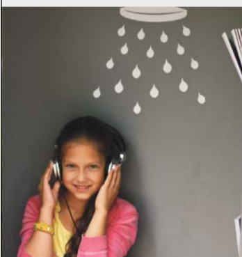
Audiodušas no biedrības Ascendum, kurās varēja ļauties Bikibuka dzejai un sapņiem