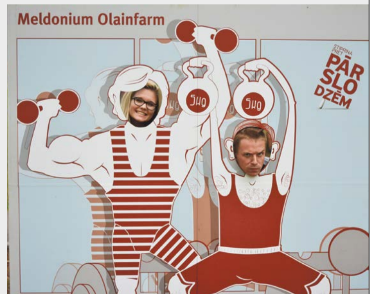
AS Olainfarm sagādātajā fotostendā ikviens varēja uzņemt kādu bildi