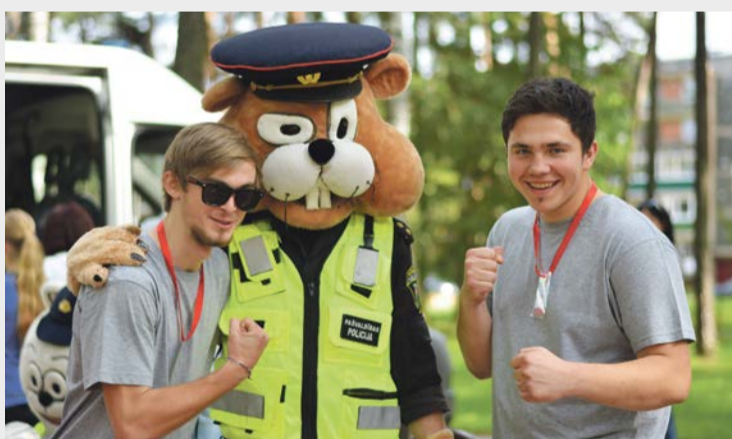
Pašvaldības policija rūpējās par ikviena jaunieša drošību