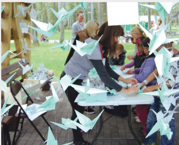
Jauniešu biedrības "Māk-onis" radošā darbnīca izcēlās ar īpašu smalkumu