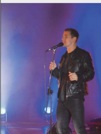
Jauniešu dienas īpašie viesi grupa "Gain Fast"