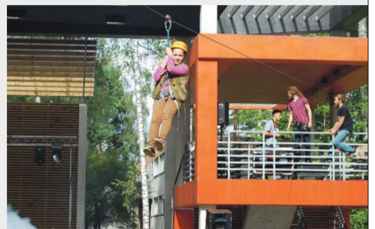
Īpaši lielu atsaucību guva trošu nobrauciens no estrādes pāri skatītāju sēdvietām