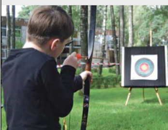
Ikviena varēja izmēģināt savus spēkus lokšaušanā